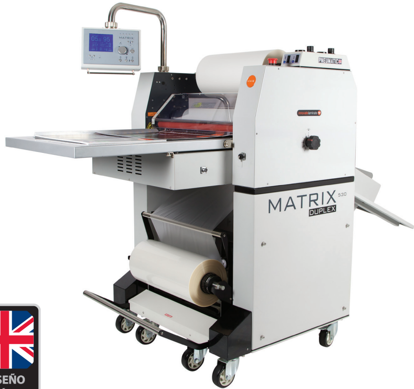
▲ MX-530 DP

acabado mate, rápidamente y sin problemas.