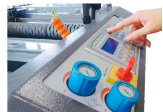
Panel de control