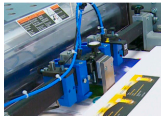
Mesa con aspiración