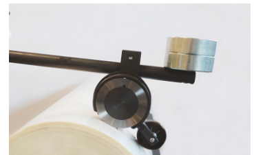
Precorte de bobina (opcional)