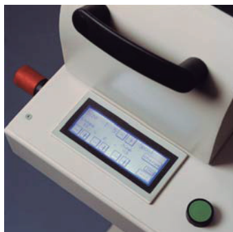
Utilización fácil de la pantalla táctil