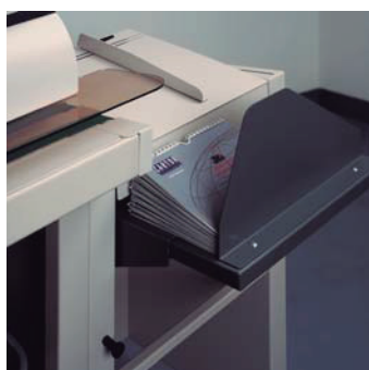
Recepción de libros