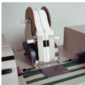
Opcional dispensador de colgadores